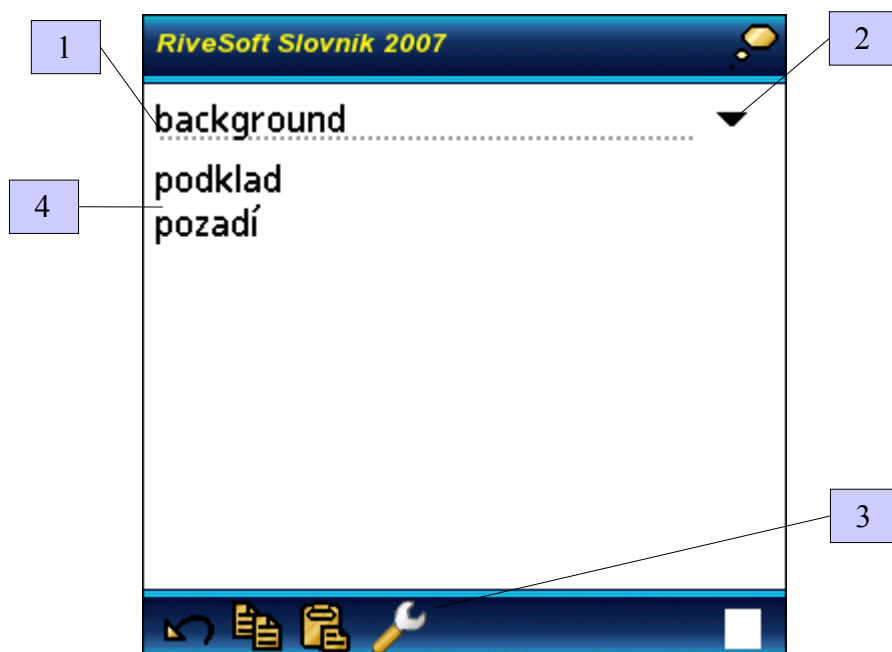
Obr. 1. Hlavní formulář slovníku s vyhledaným výrazem